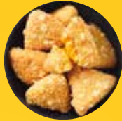
NACHO CHEESE TRIANGLES