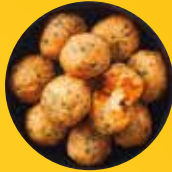
TOMATO MOZZARELLA MELTERS