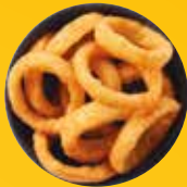
BEER BATTERED ONION RINGS