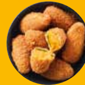
JALAPENO PEPPERS (2 FAJTA)