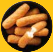
BEER-BATTERED MOZZARELLA STICKS

Az alábbiakban felsorolt Pickers harapnivalókat gondosan válogattuk össze a magas minőségük és ropogósságuk megőrzése érdekében a házhoz szállítás során.